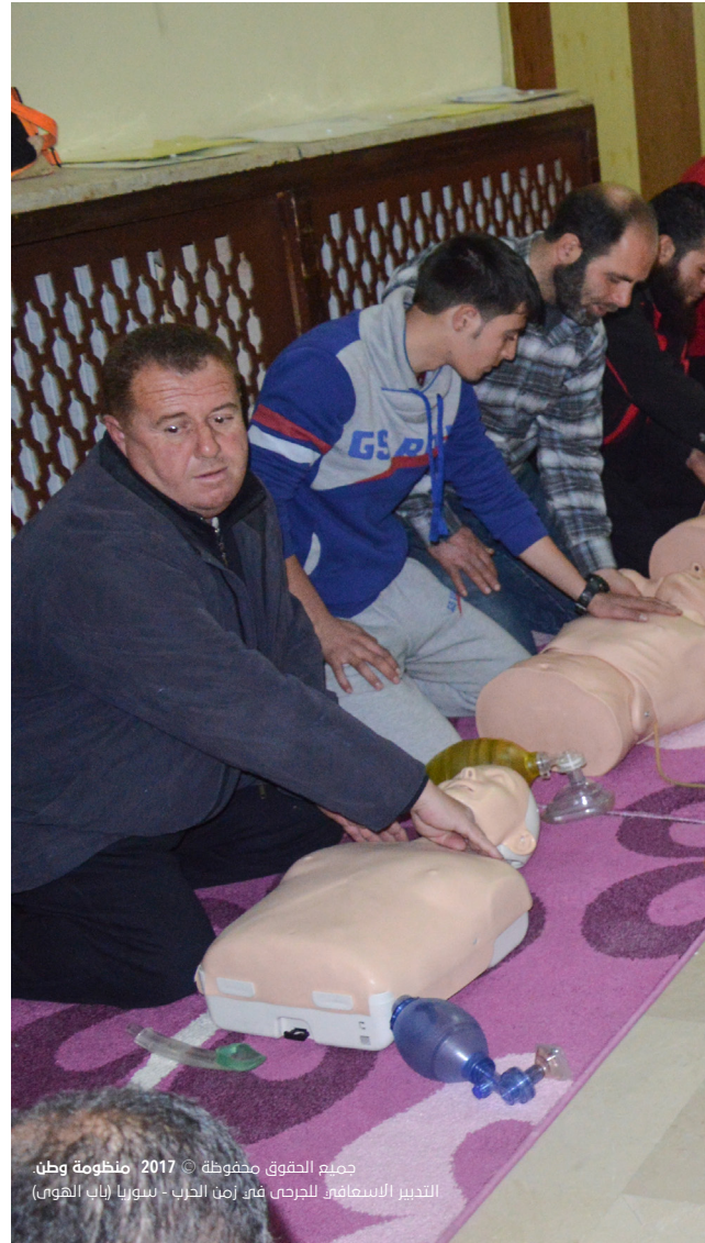
جميع الحقوق محفوظة © 2017 منظومة وطن. التدبير الإسعافي للجرحى في زمن الحرب - سوريا (باب الهوى)