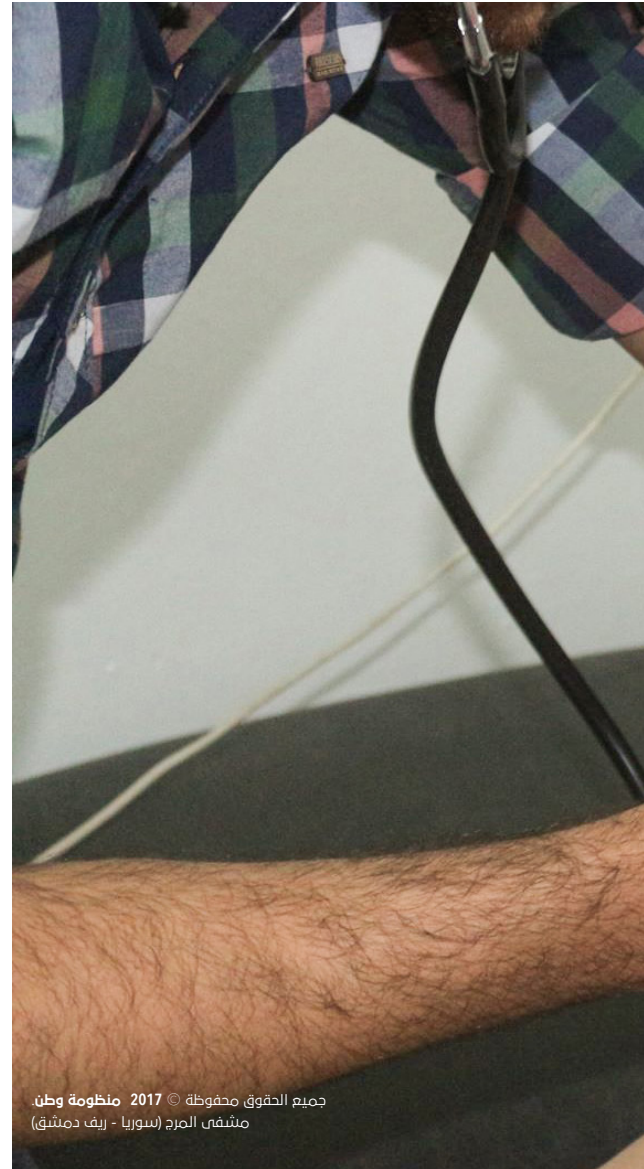
جميع الحقوق محفوظة © 2017 منظومة وطن مشفى المرح (سوريا - ريف دمشق)