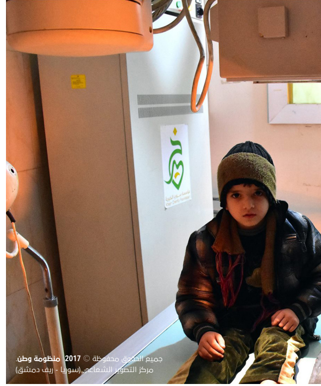
جميع الحقوق محفوظة © 2017 منظومة وطن مركز التطوير الشعاعي (سوريا - ريف دمشق)