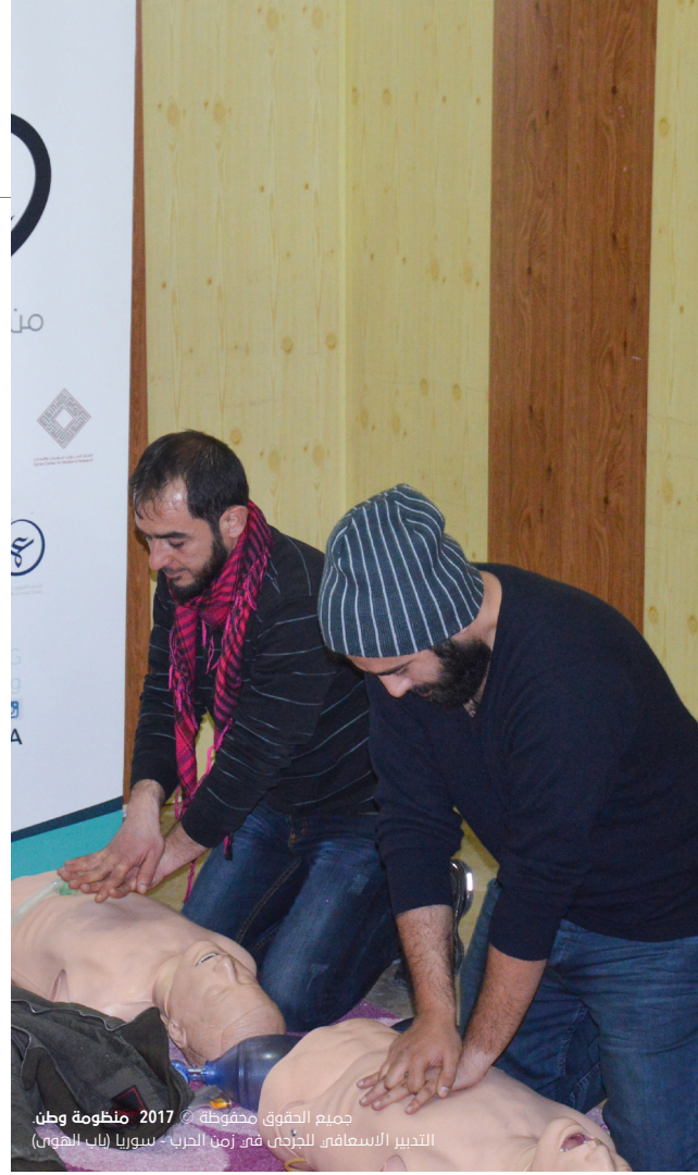
جميع الحقوق محفوظة © 2017 منظومة وطن. التدبير الإسعافي للجرحى في زمن الحرب - سوريا (باب الهوى)