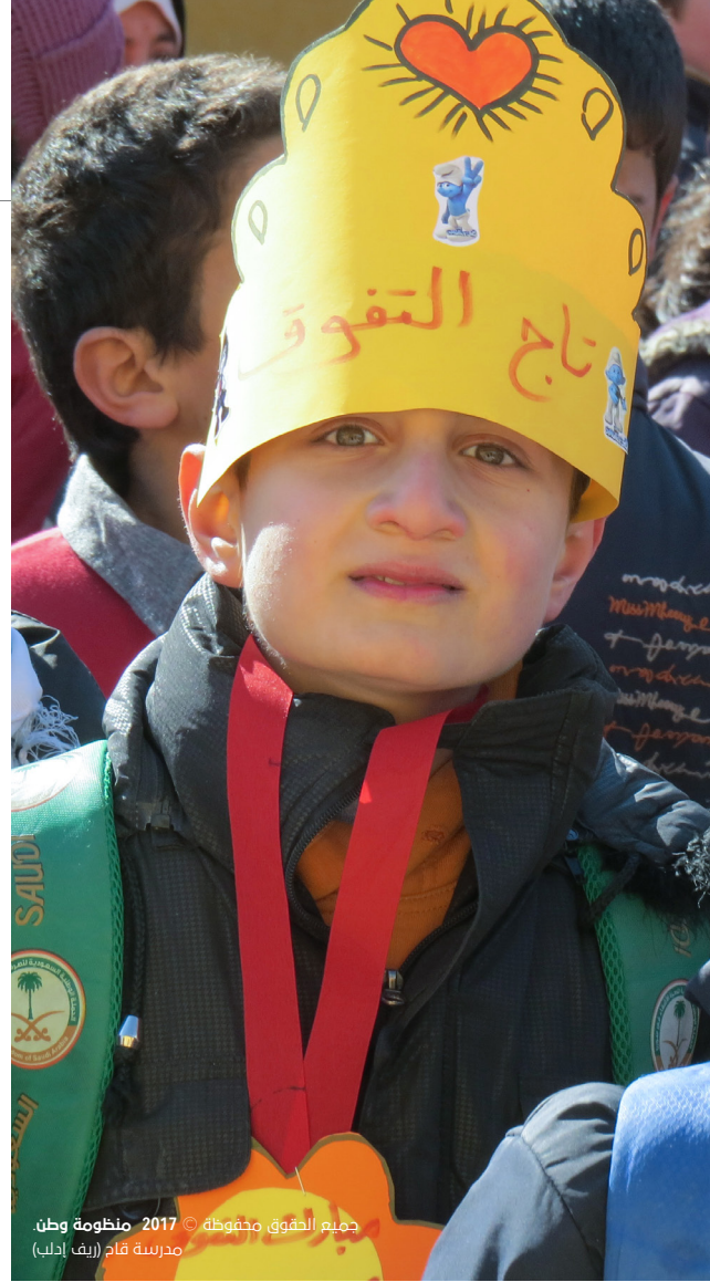
جميع الحقوق محفوظة © 2017 منظومة وطن. مدرسة قام (ريف إدلب)