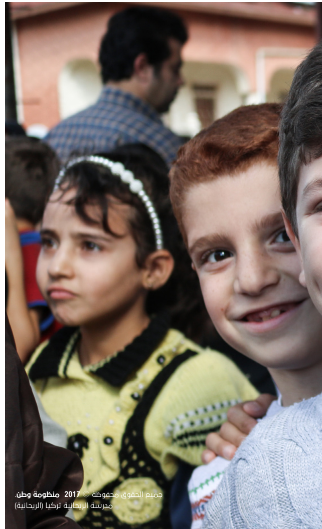
جميع الحقوق محفوظة © 2017 منظومة وطن. مدرسة الريحانية تركيا (الريحانية)